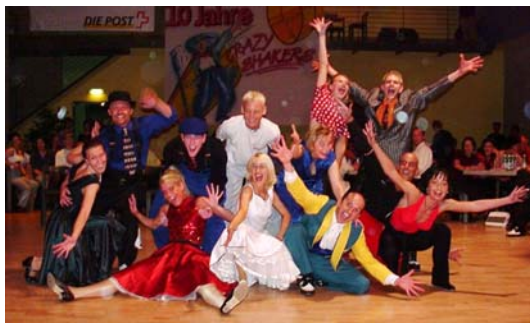
Crazy Cup 2000