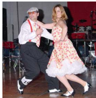
Crazy Poly Cup 2001

Zum Crazy Cup 2000 anbei der Kommentar vom Präsidenten des Dachverbands RICY (siehe www.ricy.ch ):